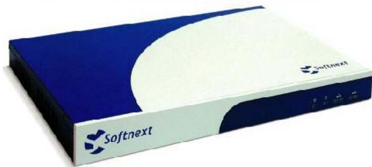
已申請台灣、日本、美國專利技術

在企業郵件伺服器收信前，SPAM SQR 會利用全效性N-Tier過濾引擎、多元攔截服務模式，搭配MySPAM個人化服務，高效率阻擋垃圾信。SPAM SQR能有效協助企業減少垃圾信件對於頻寬、郵件伺服器及MIS人員的負擔，也是使用者方便管理郵件的好幫手。SPAM SQR已成為全國最多企業組織最愛用的Anti-Spam系統。